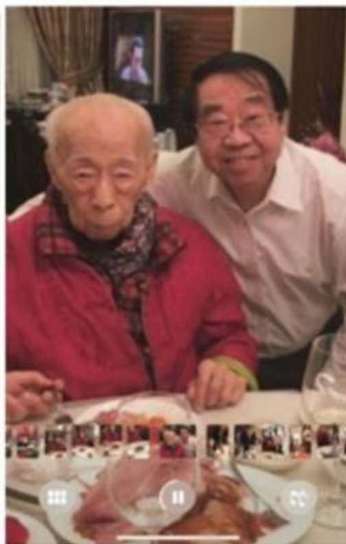
已故大紫荊勳賢饒公與作者合照