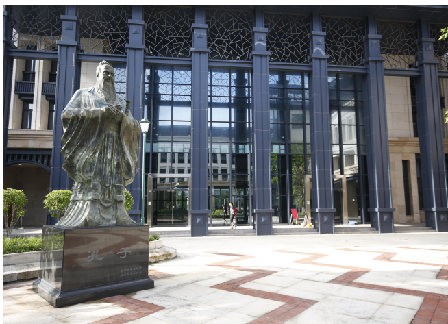
圖 2 澳大“孔子學院”於 2018 年投入運作

2.1.7 澳門大學獲國家漢語國際推廣領導小組辦公室批准設立“孔子學院”，以響應澳門政府參與“一帶一路”建設，推動澳門發展為一個面向國際，特別是葡語國家的漢語教學交流平台。